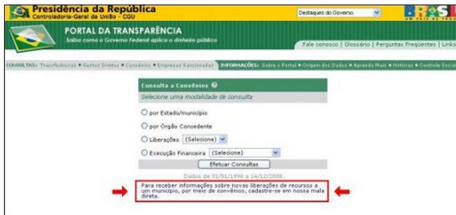
FIGURA XXXIII – Cadastramento para receber novas liberações

3) O interessado pode ainda acessar a ficha de cadastro diretamente no endereço: