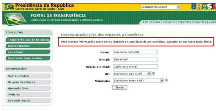
FIGURA XXXIV – cadastramento para receber novas liberações

http://www.portaldatransparencia.gov.br/convênios/ConvêniosFormulario.asp