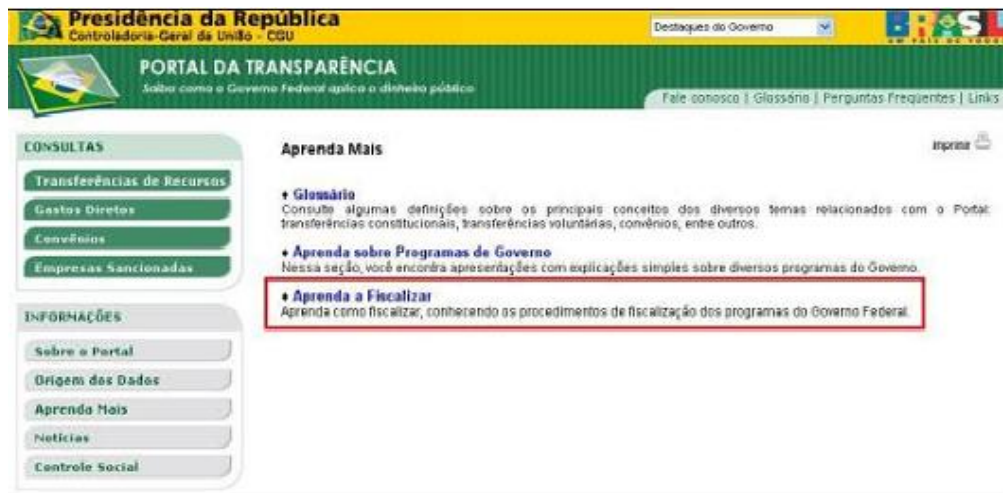
Figura VII – Aprenda Mais